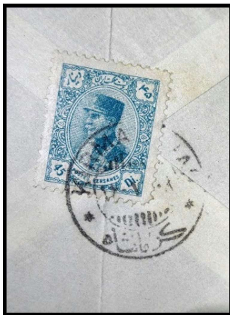
Part of envelope, fold that exist only on cover

The postage rate for sending ordinary envelopes inside the country (Iran), from October 1921 to April 1941, was 30 dinars (6 chahis) for 2 mesghals (10 grams). For each weight (5 grams) of overweight envelope, an additional amount of 15 dinars (3 chahis) was received. For Registration envelopes, 60 dinars (12 chahis) were received from the customer in addition to the normal rate. This information is registered in "Worksheet" No. 53, Iran Philatelic Study Circle. Also, this information is mentioned in the PARS Yearbook, published in "Parliament Press" in 1934.