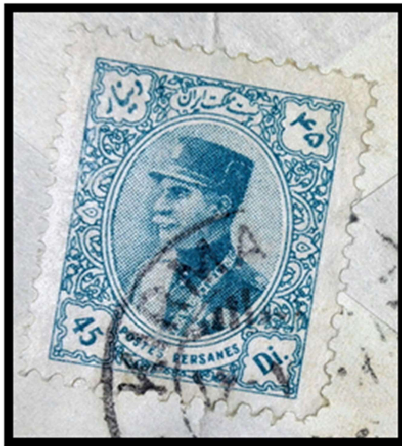
There isn't fold on stamp

I guess, first, letter write and put in cover then address write. The Letter writer bring envelope to post office he fold cover and put it on her pocket and when he arrive to post office deliver it to post operator and operator stick two piece of stamp on cover. So we see fold only on cover and not on stamp.