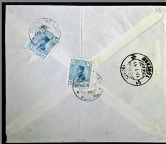
تصویر روی پاکت نامه