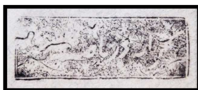
تصویر درشت از مهر پستی "کرایه دریافت شد" متعلق به دفتر پستی بندر عباس