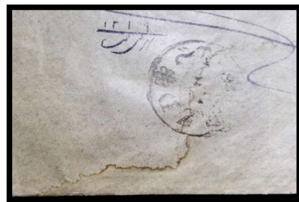
ایجاد هاله زرد ناشی از آب

به کمک قلم موی مرطوب شده با آب مقطر (استفاده از آب مقطر مانع ایجاد رسوب و هاله زرد پس از خشک شدن، روی پاکت می شود).