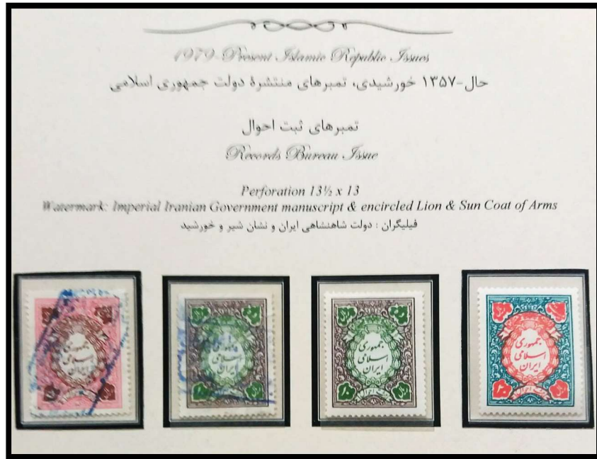
تمبر ثبت احوال، جمهوری اسلامی ایران، تاریخ مصرف: سال ۱۳۵۹-۱۳۵۸ خورشیدی