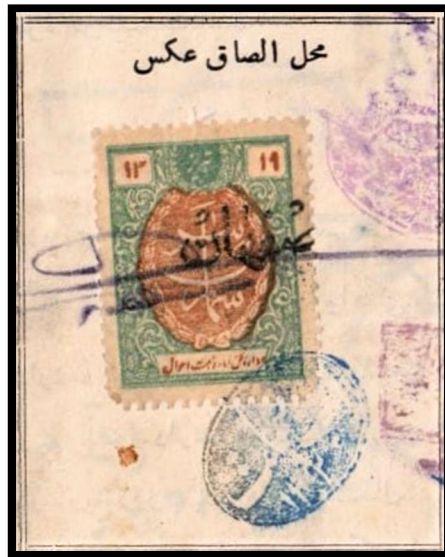
نمای درشت از تمير شناسنامه