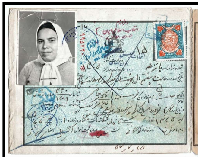
شناسنامه با تمبر ۲۰ ریال ثبت احوال