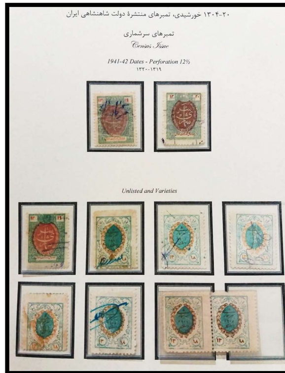
تمبرهای سرشماری، نمایش نوع و گوناگونی رنگ تمبر (Type & Variation)