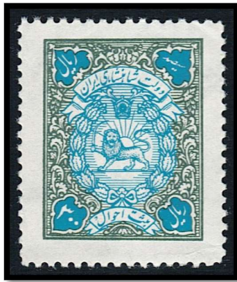
تمبر ۳۰۰ ریال ثبت احوال دولت شاهنشاهی ایران