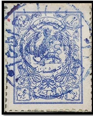
تمبر دو ریال شناسنامه اداره کل آمار و ثبت احوال