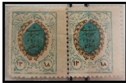
جفت (Pair) تمبر سرشماری، کمیاب