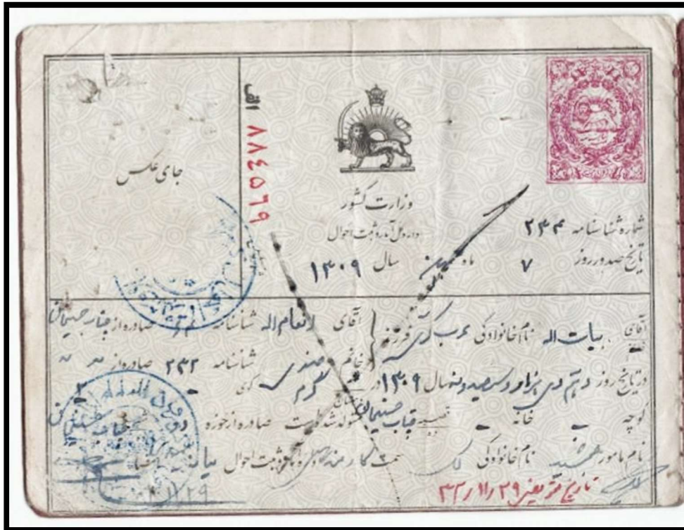
شناسنامه با نقش تمبر دو ریال