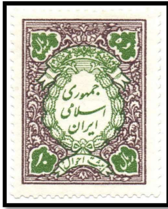
تمبر ۱۰ ریال ثبت احوال، جمهوری اسلامی ایران*