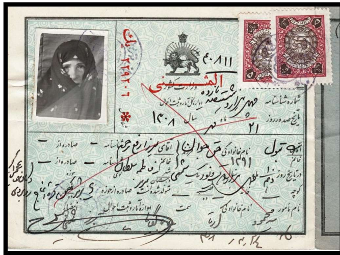
شناسنامه با دو قطعه تمبر ۵ ریال ثبت احوال (ده ریال)