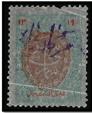
تمبر سرشماری، دولت شاهنشاهی ایران، تاریخ مصرف: ۱۳۱۹ خورشیدی اداره کل آمار و ثبت احوال