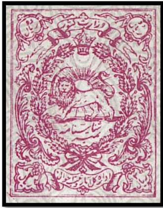
دو ریال نقش تمبر روی شناسنامه