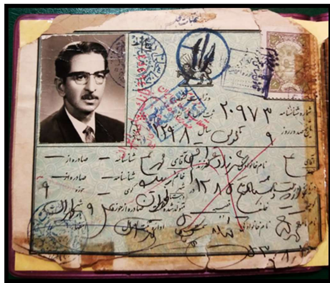
شناسنامه با تمبر ۱۰ ریال ثبت احوال