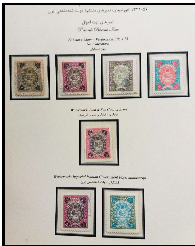
تمبرهای ثبت احوال، رقم ۲ ریال تا ۳۰۰ ریال، دوره مصرف ۱۳۲۱-۱۳۵۷ خورشیدی