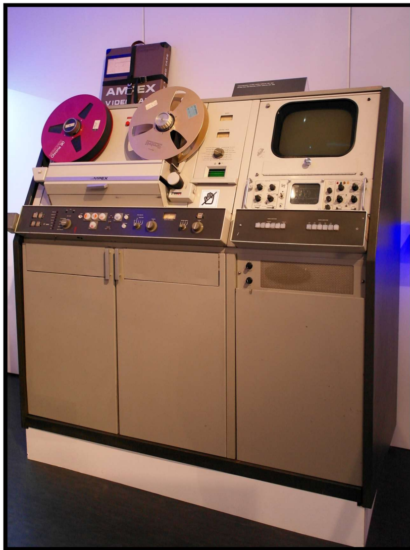
Ampex VR-2000 2-inch Quadruplex VTR (1960)

در حیطه ضبط تصویر، اولین دستگاه های ضبط استفاده شده در تلویزیون ایران ساخت شرکت امپکس بود که از نوارهای مغناطیسی دو اینچ بدون کاست (محافظ) در آن استفاده می شد. پهنای این نوارها ۵ سانتیمتر بود. بعدها پس از استفاده و تجهیز واحد ضبط استودیویی با دستگاه های جدیدتر مانند یوماتیک و ... همچنان در بین عوامل تولید، این واحد را با نام امپکس می شناختند.